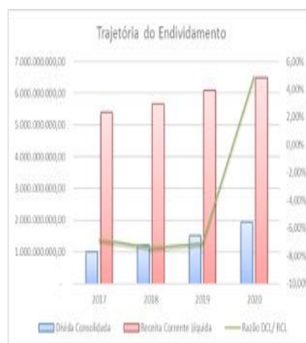
Gráfico 2 – Evolução do endividamento de Salvador

O gráfico abaixo indica a trajetória da dívida consolidada do município e de sua RCL entre os exercícios de 2017 e 2020. Nas barras de cor azul e vermelha, respectivamente, é possível observar um maior crescimento, em valores absolutos, da RCL em detrimento ao endividamento nos três primeiros períodos, porém, para o último período, 2020, tal crescimento se inverte com o aumento da dívida em maior volume que o da RCL.